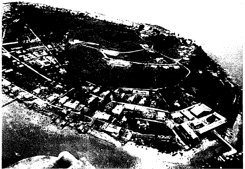
Luchtfoto van het eiland Doom.

Overvaartdiensten Doom-Vastewal worden onderhouden met 2 Hollandlaunches, welke om het half uur van 07.00–22.00 varen.