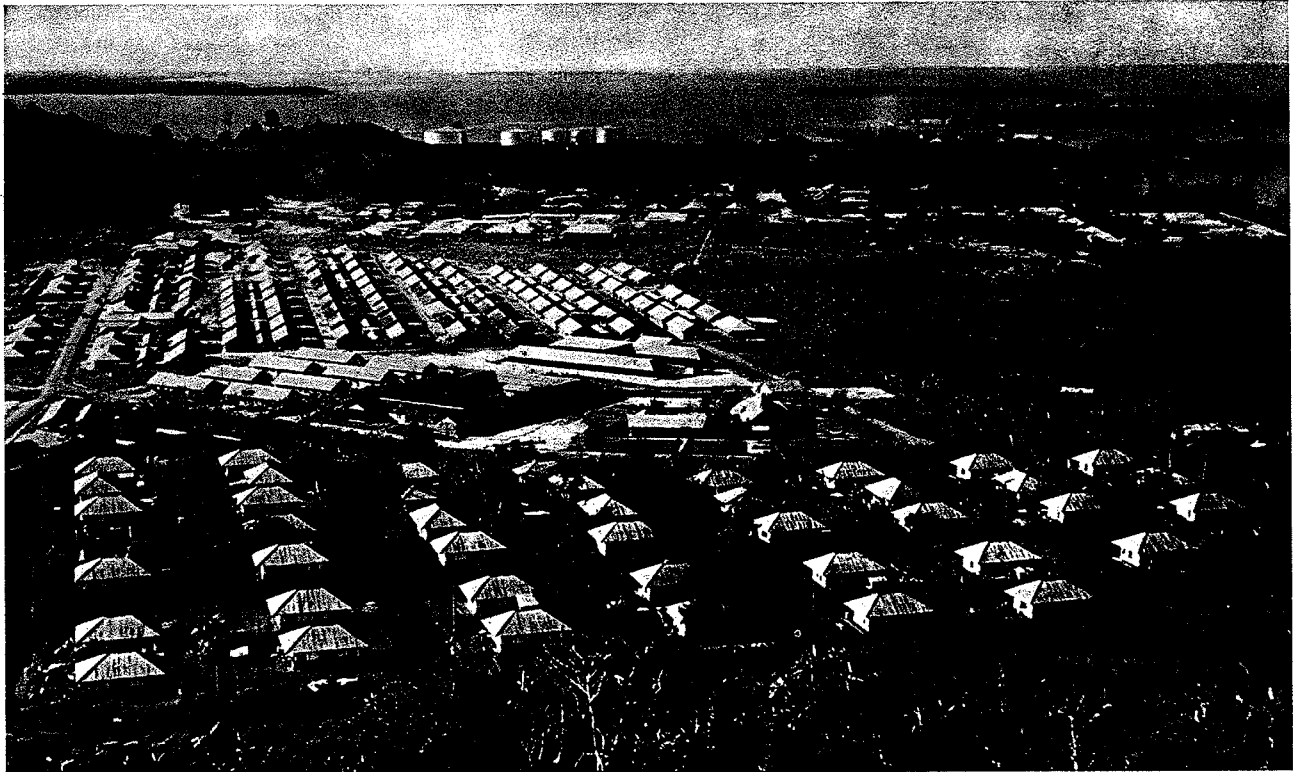
Woningen van het personeel der N.N.G.P.M. te Sorong.