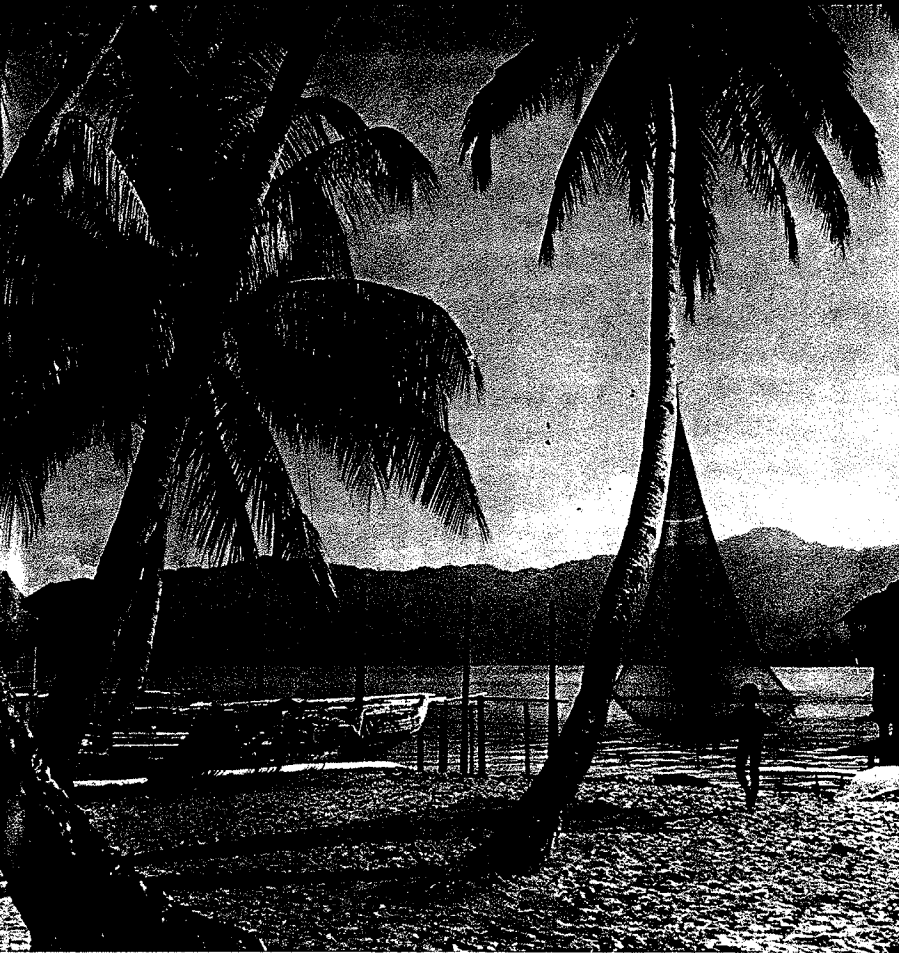
Aan de Wandammenbaai