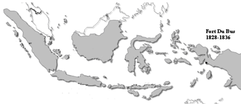
Figuur 1: Fort Du Bus binnen de Indische Archipel

Reeds bij de aanleg van het fort werd het duidelijk dat Elout het in 1827 bij het rechte eind had toen hij opmerkte dat een vestiging op de kust van het eiland ‘aan vele zwarigheden onderhevig is’. Uit het verslag van Salomon Müller, die aan de reis van de ‘Iris’ en de ‘Triton’ deelnam ten einde een natuurkundig onderzoek op het eiland te doen, blijkt dat ‘vele manschappen weldra ziek werden’. 40 De Italiaanse graaf Vidua de Gonzano kwam een jaar later tot een gelijklopende conclusie. Hij had medelijden met de militairen die op de kust van Nieuw-Guinea waren gestationeerd ‘drie of vier honderd mijlen van Amboina verwijderd, zonder eenige ondersteuning, in een land, dat niets voortbrengt, welks inwoners op den laagsten trap van beschaving staan en de grootste verraders zijn’. 41 Als men daar de notoire ongezondheid van de omgeving van het fort, Merkusoord genaamd, bij optelt is het begrijpelijk dat een uitzending derwaarts onder de troepen op de Molukken opgevat werd ‘alsof reeds bij derzelve benoeming een doodvonnis over hun werd uitgesproken’. 42