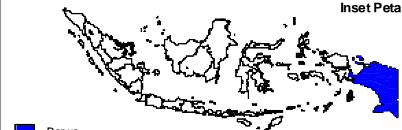
Inset Peta Provinsi