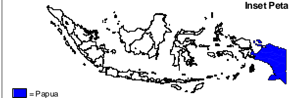
Inset Peta Provinsi